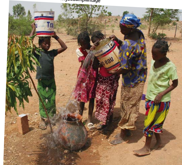
Kinder bewässern die Mangobaumplantage

Die gesamte Dorfgemeinschaft wird in alle Entwicklungsprozesse integriert. Nur so werden die erzielten Ergebnisse geschätzt, bewahrt und weiterentwickelt. Diese nachhaltige Methode konnten wir bereits in anderen Landesteilen und in Nachbarländern wie Togo und Mali erfolgreich umsetzen.